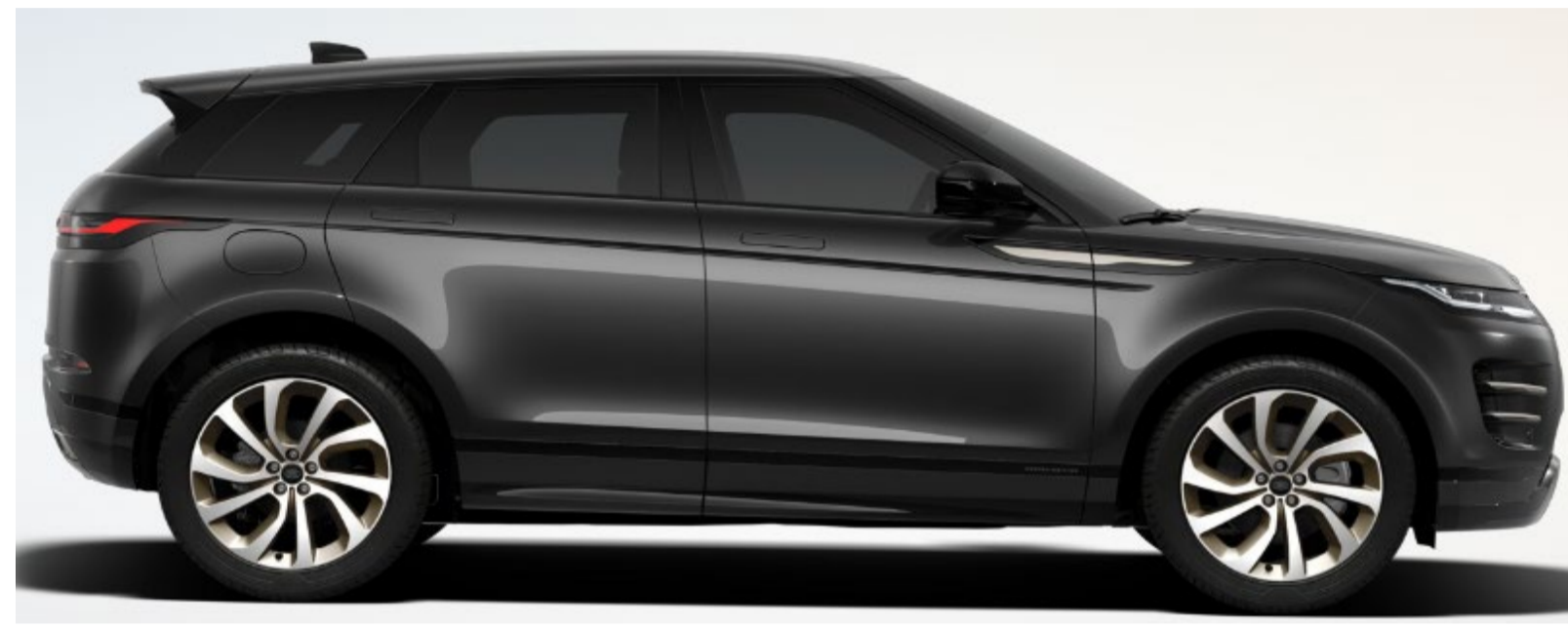
20" Style 5089, Satin Gold wheels with Diamond Turned contrast