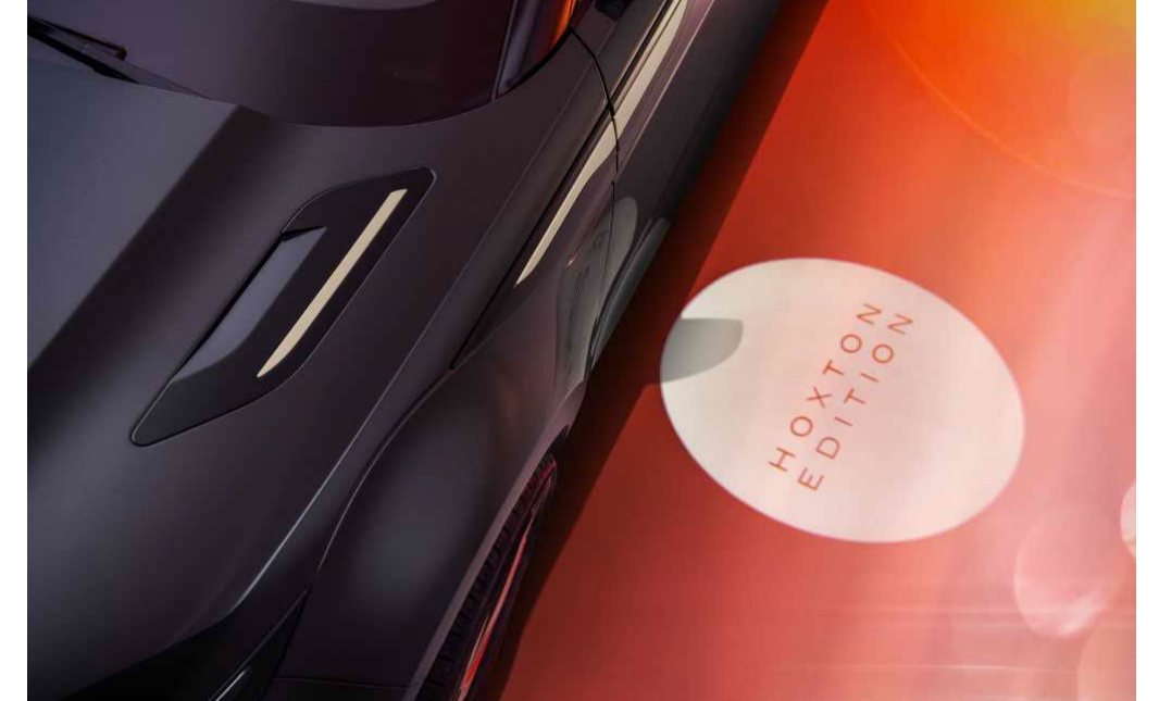
Puddle Lamp Projection