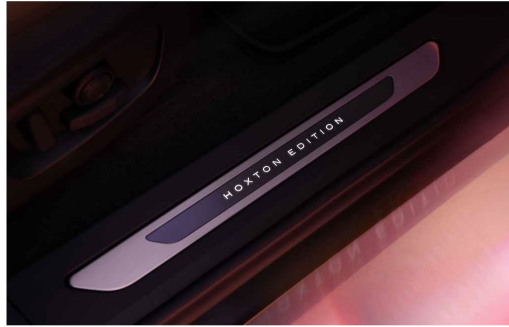
Illuminated Front Treadplates