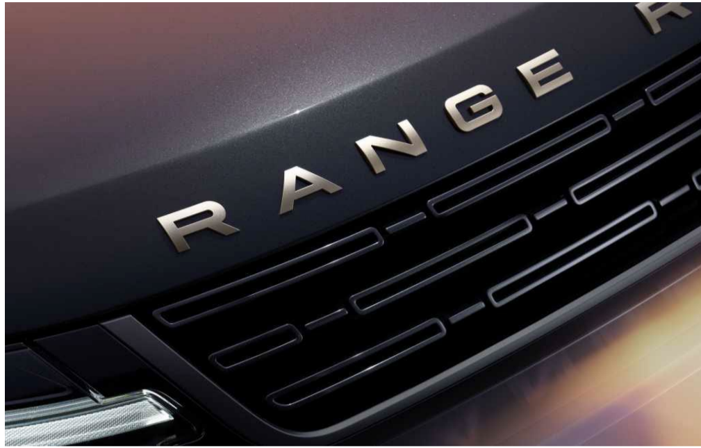
Platinum Atlas lettering