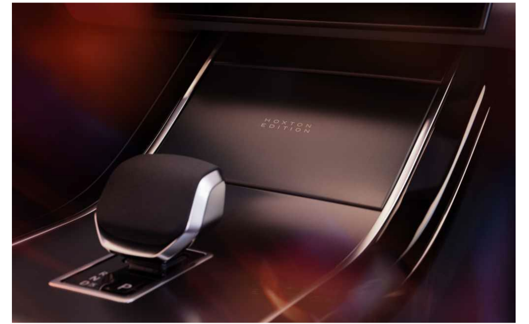
Black Brushed Aluminium Finisher